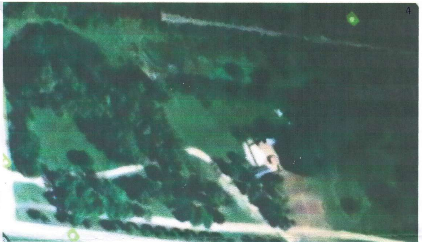
Imagen Aerea del predio